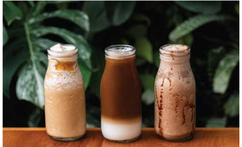
Caramel frappé, Iced latte, Moka frappé