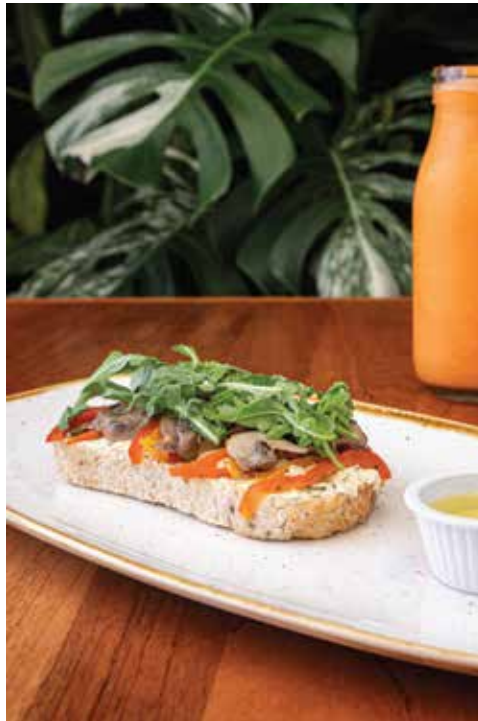
Toast de hongos