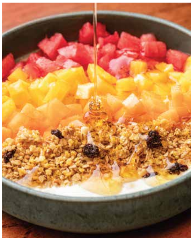
Bowl de frutas con yogurt y granola