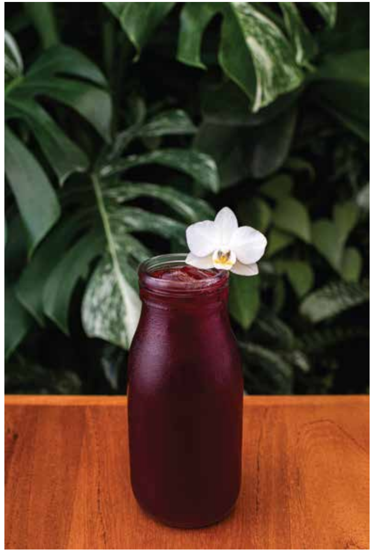
Rosa de jamaica