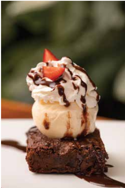
Brownie con helado