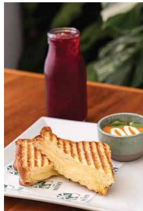
Grilled cheese panini