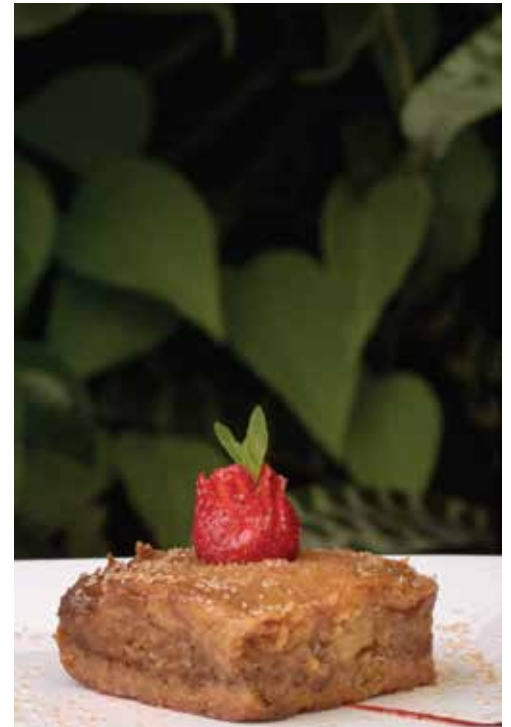
Pastel de rellenito