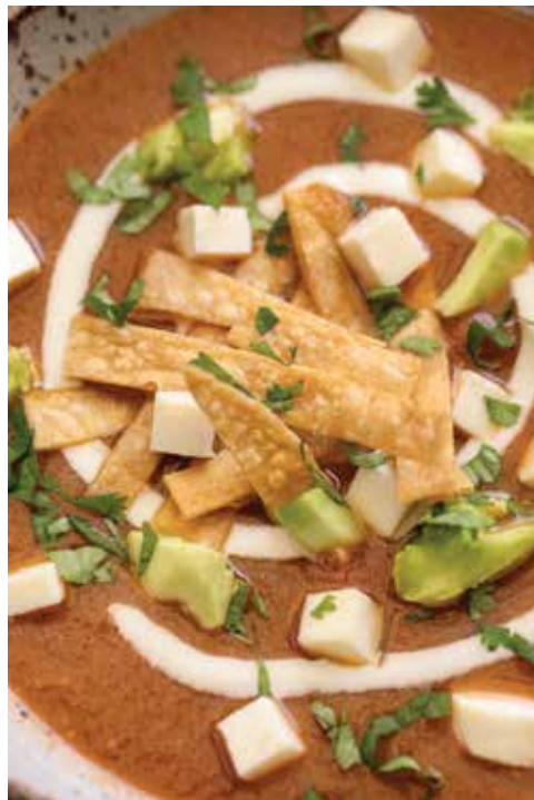
Sopa de tortilla