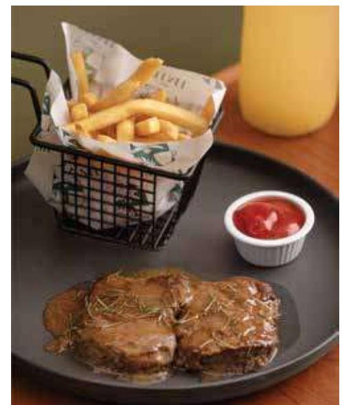
Lomito al Zacapa

Elige tu acompañamiento: papas fritas, papas de camote, ensalada o vegetales salteados.