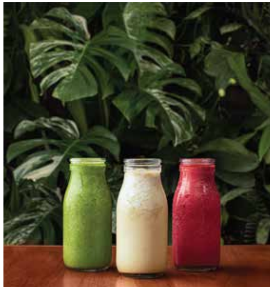
Smoothie Verde, Blanco y Rojo