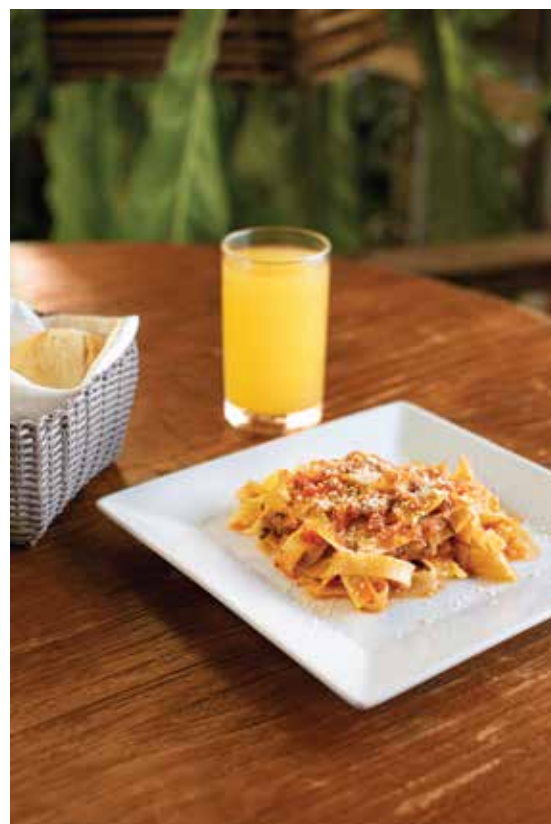
Mini pasta pomodoro