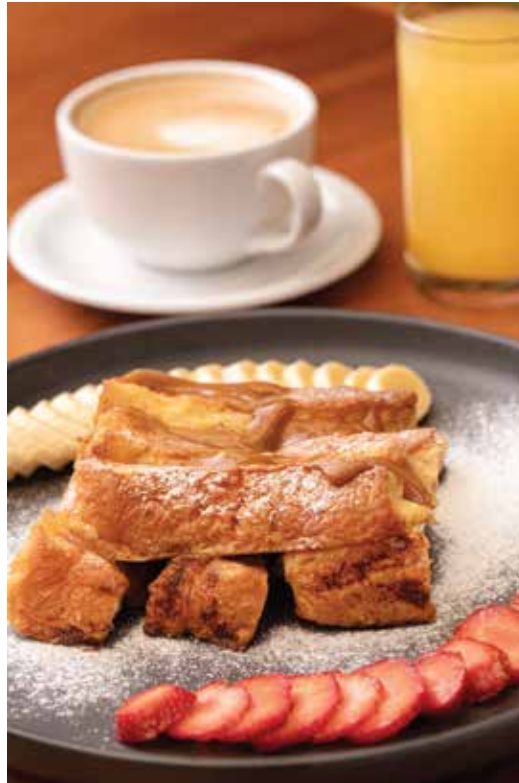
Tostadas a la francesa