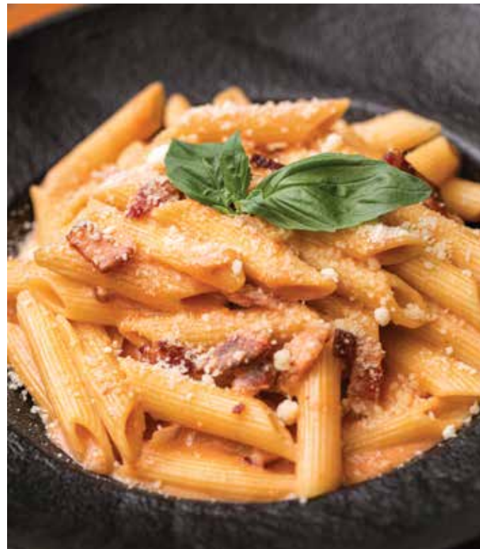
Pasta fetuccini carbonara