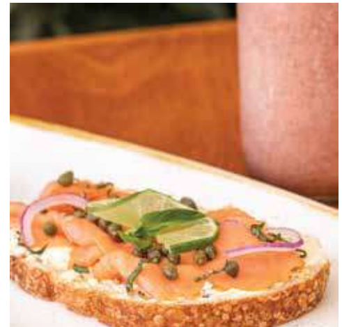
Toast de salmón