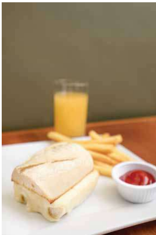
Mini grilled cheese