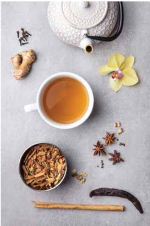
Infusión de Chai