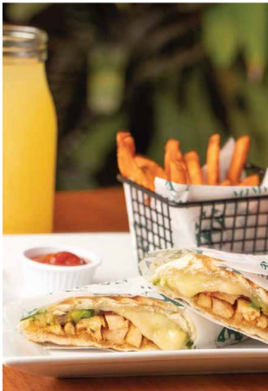
Panini spicy chicken